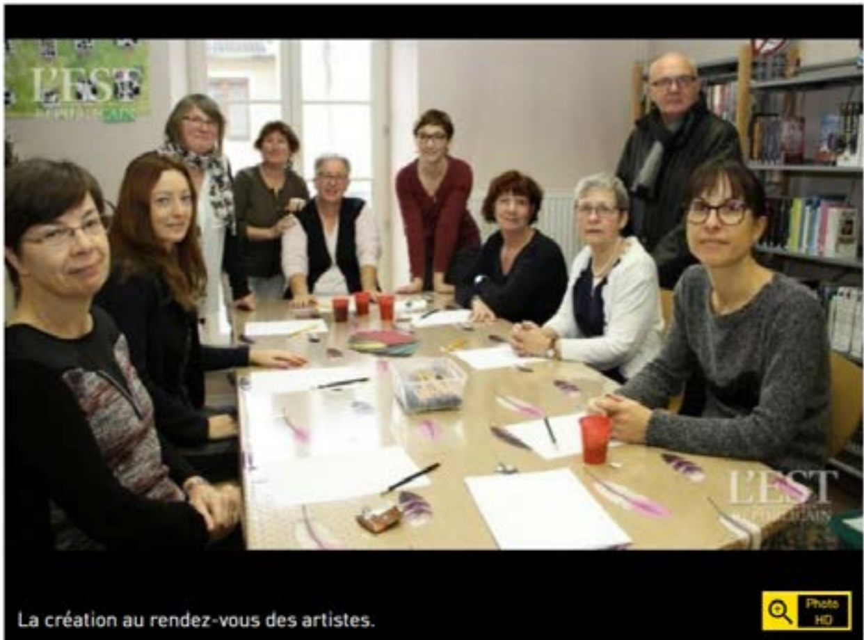
La création au rendez-vous des artistes.

VU 10 FOIS | LE 29/11/2017 À 05:00 | 0 RÉAGIR